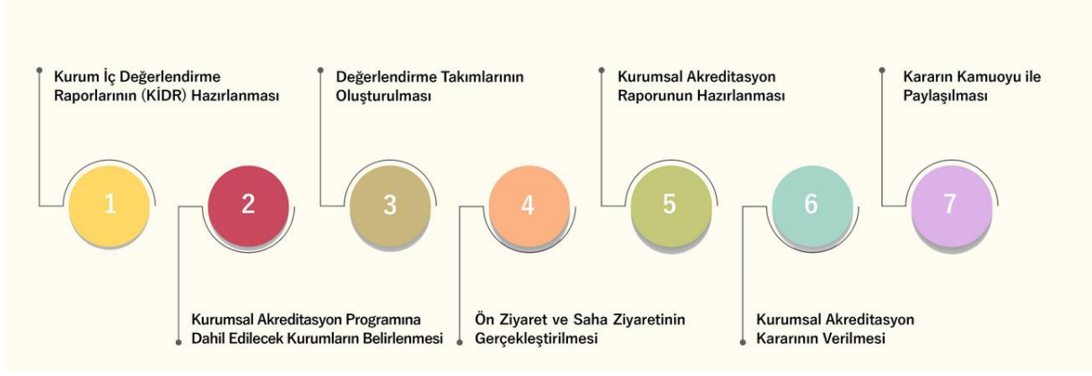
Şekil 3 Akreditasyon programı değerlendirme süreç haritası

YÖKAK tarafından KAP kapsamında aşağıdaki kararlar verilmektedir: